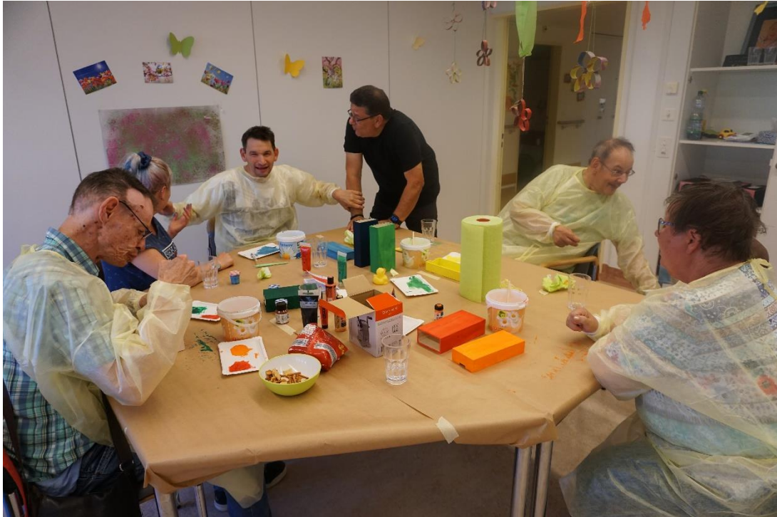
Foto- und Spielspass